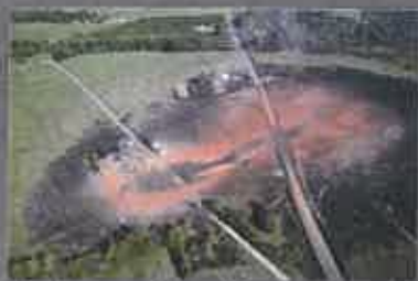
Conséquences d'une fuite sur une canalisation de transport, Appomatox (USA), 14 septembre 2008.