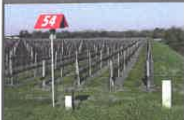
Différents types de bornes repèrent les canalisations de transport